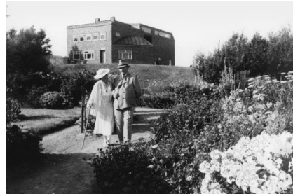
Ada og Emil Nolde i haven i Seebüll, 1941

Beboelses- og atelierhuset Seebüll, som Emil Nolde selv har tegnet, er et af “det modernes” fremragende kunstnerhuse. Med videreudviklingen af Seebüll har der været tale om langt mere end en renovering af et historisk mindesmærke. Stillet over for den kendsgerning, at huset med sine diverse til- og ombygninger fra såvel Noldes levetid som efter hans død i 1956 fortæller sin egen bygningshistorie, var overvejelserne: Hvilken hovedide, hvilket bygningsmæssigt-rumligt og funktionelt koncept, og hvilken historie skulle dette næste lag af huset fortælle og sætte sit præg på. Stiftelsens tilsynsråd inddrog rådgivere fra kulturstyrelsen om bavaringsværdige monumenter, fra Nordfrislands forvaltning, fra byggeministeriet og fra fagområderne arkitektur og bygningsbevaring.