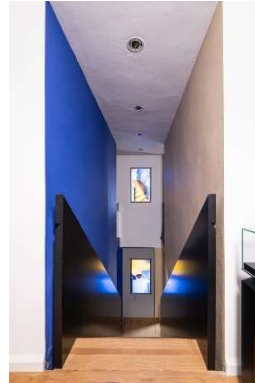
Trappeopgang til kabinetterne i det sanerede historiske Nolde-hus

I forbindelse med renoveringen næsten hundrede år efter at Nolde-huset blev bygget blev alle bygningens lag tilbage fra opførelsestidspunktet studeret omhyggeligt. Alle beboelsesrummene i stueetagen stod næsten uforandret med den originale møblering, og det samme gjaldt billedsalen i overetagen.