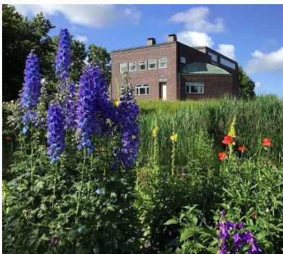
Det ny renoverede historiske Nolde-hus, sommer 2022