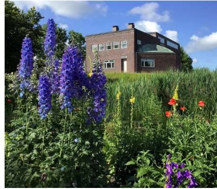
Det ny renoverede historiske Nolde-hus, sommer 2022