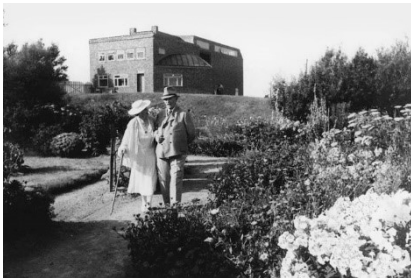
Ada og Emil Nolde i haven i Seebüll, 1941