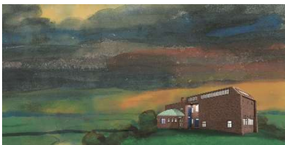
Visualisering af det sanerede historiske Nolde-hus i akvarellen „Seebüll“ af Emil Nolde