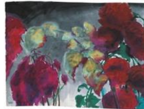
Georginer, efterårsløv og nævhaler (rød og rødlig violet), Akvarel

For Emil Nolde er haven på én gang et sted, hvor han kan trække sig tilbage, og en kilde til inspiration. Alle de steder på landet, hvor han har haft sit hjem, har han anlagt en blomsterhave. Fra omkring 1917 begynder han på en serie af akvareller med blomstermotiver. Nolde koncentrerer sig om enkelte store blomsterknopper i lysende farvetoner og kombinerer ofte kontrasterende former og farver: Amaryllis og alpeviol, tulipaner i rødt, orange og lilla. I zoologiske haver og på sydhavsrejsen finder han de eksotiske planter, der understreger de næsten helt surrealistiske kontraster. Blomsterne personificerer menneskelige følelser og stemninger i deres vækst, blomstring og visnen og ligner næsten portrætter i deres ekspressive individualitet. "Jeg elskede blomsterne med deres skæbne: fremspirende, blomstrende, lysende, glødende, lykkeliggørende, bøgende sig, visnende, til sidst kastet i graven". Som over 80-årig maler Nolde stadig blomsterakvareller, der er inspireret af blomsterne i hans paradisiske have på Seebüll, og det fortsætter han med næsten til sin død.