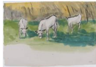
Tre græssende køer, Akvarel 1950, © Nolde Stiftung Seebüll

"... det glødede af kærlighed til det hjemlige landskab"