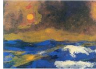
Hav med gul sol, Akvarel, © Nolde Stiftung Seebüll

"Det store, brusende hav er stadig i sin urtilstand"