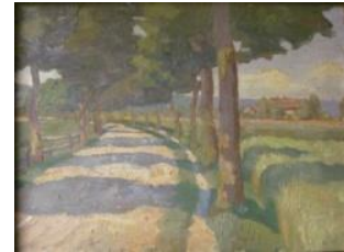
„Landevej“, Maleri 1898

Den store expressionist Emil Nolde gik sin vej målbevidst. Han var allerede over 30 år gammel, da han kunne virkeliggøre sin livsdrøm, nemlig at blive kunstner. 1898, i januar måned, på det tidspunkt færdig uddannet kunsthåndværker og stadig med familienavnet Hansen, tager han til München, for at lære maler-håndværket og selve teknikken. Kernepunktet af den 62. årsudstilling i Seebüll er vandreårene, hvor maleren opdager farven. Vejen fører ham via München, Polling, Dachau, Paris og København tilbage til sin hjemstavn i det dansk-tyske grænseområde. For første gang præsenterer vi nogle af de dengang opståede værker i større omfang. De genspejler de næppe kendte udviklingstrin fra den lerfarvede realisme til den atmosfæriske impressionisme og derudover. Det er forbløffende, som man erkender Noldes udvikling til farvens tryllekunstner. I selve farven fandt han den egentlige form for at udtrykke sig og blev til en af expressionismens vigtigste repræsentanter. Ud over den ukendte Nolde bliver der vist 150 værker af adskillig teknik og fra alle skabertrangens faser kendte mesterværker såvel som andre jævnbrydige skatte fra stiftelsens værdifulde forråd.