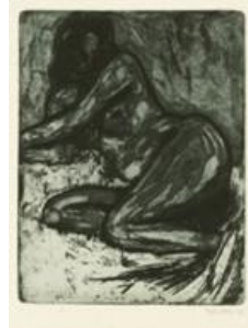
Nøgenstudie, Ætsning, mørk, kontrastrig ætsning i ler 1906, © Nolde Stiftung Seebüll

"... den herværende kunstnersammenslutning 'Brücke' vil anse det for en stor ære at kunne hilse Dem velkommen som medlem"