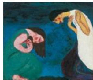
„Forkyndelse“, Maleri 1926

De religiøse billeder hører til de mest betydningsfulde og samtidig til de mest omdiskuterede af Emil Noldes værker. Efter hans eget skøn blev de første malerier i denne serie malet i 1909, og i 1911/12 skabte han sit hovedværk med det nidelte "Kristi liv". Alene midtærtavlen, "Korsfæstelsen", er det største maleri i Noldes samlede øvre. For at kunne udstille dette afgørende værk i Noldes tidligere "værksted", blev gulvet sænket cirka en meter, og de nordvendte vinduer muret til.