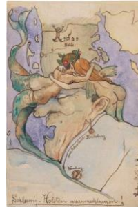
„Slesvig-Holsten havomkranset“, Akvarel, 1895 © Nolde Stiftung Seebüll

"Frigørelsen fra hjemstavnen var lykkedes"