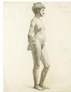
Stående kvindelig nøgenmodel, Paris 1899, © Nolde Stiftung Seebüll

"... store kunstnernaturer finder uforstyrret deres vej"