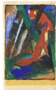
Franz Marc, To ræve, Gouache 1913

Heckel, Kirchner, Schmidt-Rottluff, Jawlensky og Marc i Noldes samling